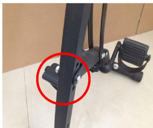
A. Використовуйте гвинт для фіксування педалі