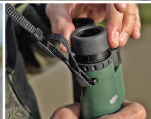
Einfach einzustellen: Perfekt an Ihre Sehbedürfnisse anpassbar.