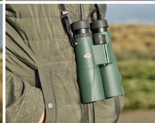
Einfach mitzunehmen: Ergonomisch geformtes, leichtes Gehäuse.

Basierend auf über 60 Jahren Erfahrung an Entwicklung und Produktion von hochwertigen Optiken, hat Kowa diese modernen und bezahlbaren Ferngläser der SV II-Serie auf den Markt gebracht.