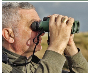
Einfach hell und klar: Voll mehrfach vergütete Optik.